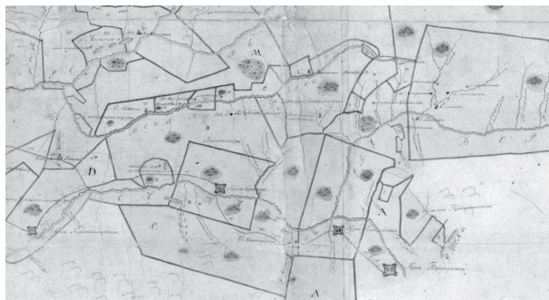
Рис. 3. Фрагмент плана-карты «Осмотр и описание Оренбургской губернии Самарской линии все их положения... по реке Самаре и впадающим в оную рекам, крепостным землям отводам и остальным...» (1771 г.), на котором приведена территория расположения Бузулукского бора

Одними из первых исследователей бора являлись лесники и лесные ревизоры. Именно в их отчетах можно найти сведения о состоянии лесного массива. «Несчастливыми для бора были годы после генерального обмежевания его, когда он сторел почти дотла, и, по рассказам старых полесовщиков, голые пески без леса были на много верст», – сообщается в «Полном хозяйственном описании дачи Бузулукский бор», документе 1843 г., составленном местным лесным ревизором [14, с. 7]. По его же данным, в течение 50 лет «в нём не велось правильного хозяйства, велись неправильные выборочные рубки и без знания дела» [14, с. 7]. В июне 1769 г. Оренбургский край посетил академик П. С. Паллас (1741–1811). Маршрут его экспедиции лежал по Самарской укрепленной линии на Оренбург [15, с. 12]. 21 июня 1769 г. он проехал Борскую крепость [16, с. 312–313]. В бор ученый не заезжал. Описывая окрестности Борской, П. С. Паллас сообщал, что «весь широкий буерак [ранее он называет его Старица], или, лучше сказать, глубокая долина, заросла соснами, липами, дубами, березами, осинами, тополью, татарским кленом, крушиной, раkitником, таволгою и сибирским гороховым деревом. Смешанный сосновый лес простирается вниз Самары почти непрерывно даже до Красносамарска; да и лежащие от Борска к правому берегу Самары горные увалы по большей части обросли высоким смолистым лесом и чепыжником. Такой с соснами смешанный лес называют там бором, по чему и крепость проименована» [16, с. 312–313]. Еще он сообщал, что около